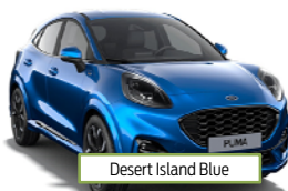
Desert Island Blue