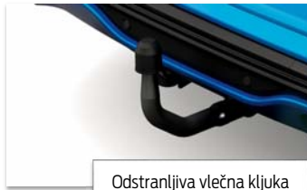
Odstranljiva vlečna kljuka