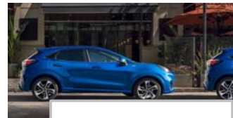
Aktivna pomoč pri parkiranju