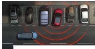
Prepoznavanje prečnega prometa